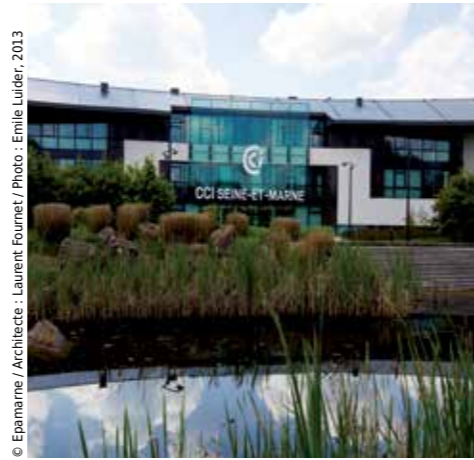
© Epamarne / Architecte : Laurent Fournet / Photo : Emille Luidier, 2013